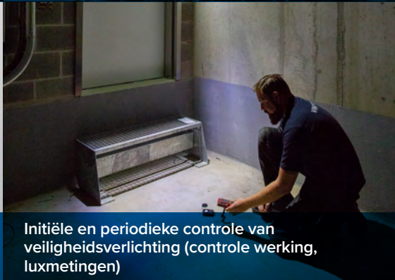
Initiële en periodieke controle van veiligheidsverlichting (controle werking, luxmetingen)