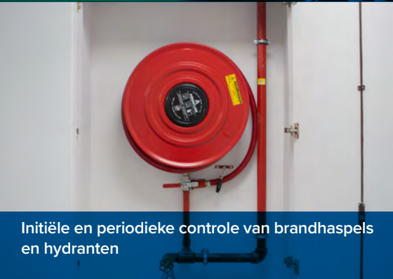
Initiële en periodieke controle van brandhaspels en hydranten