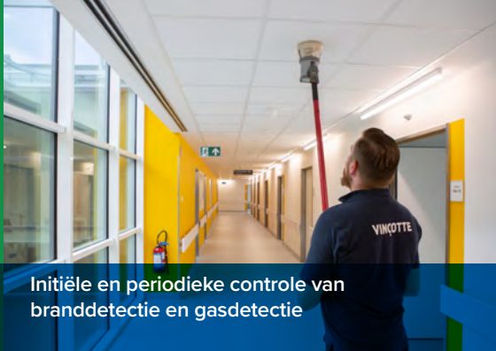
Initiële en periodieke controle van branddetectie en gasdetectie