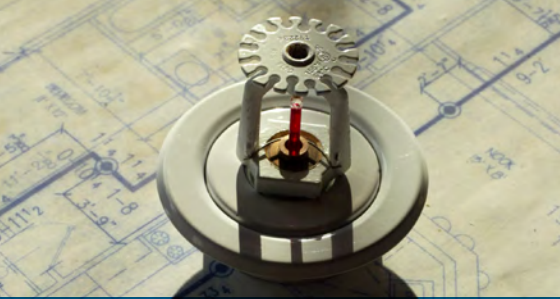
Technische controle van de brandveiligheid voor bouw projecten o.a. in het kader van de verzekering voor de tienjarige aansprakelijkheid van ontwerpers en aannemers