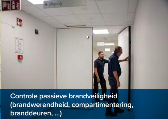
Controle passieve brandveiligheid (brandwerendheid, compartimentering, branddeuren, ...)