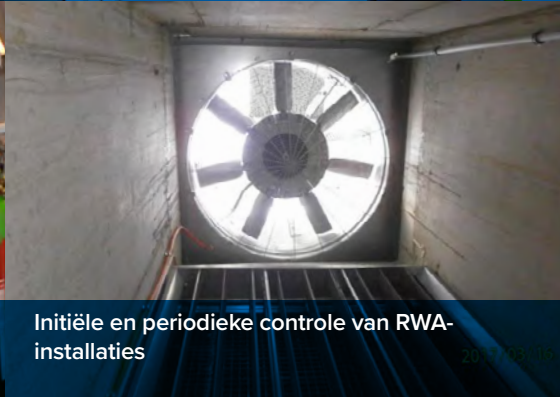
Initiële en periodieke controle van RWA-installaties