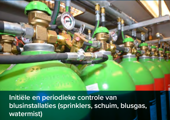
Initiële en periodieke controle van blusinstallaties (sprinklers, schuim, blusgas, watermist)